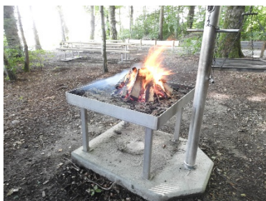
Die Feuerstelle

Das Wetter zeigte sich dieses Jahr von der guten Seite.