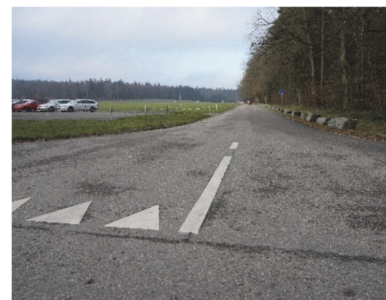
Einmündung in die H1

BS. Nach dem JA der Berner Stimmberechtigten im Mai 2017 zur Umfahrung Aarwangen laufen die Arbeiten gemäss Planung. Derzeit hat der Kanton die Planungsarbeiten für den Bau der Strasse öffentlich ausgeschrieben.