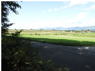
Richtung Weissenstein

Das Wetter zeigte sich dieses Jahr von der guten Seite.