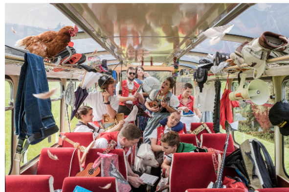
Hitziger Appenzeller Chor