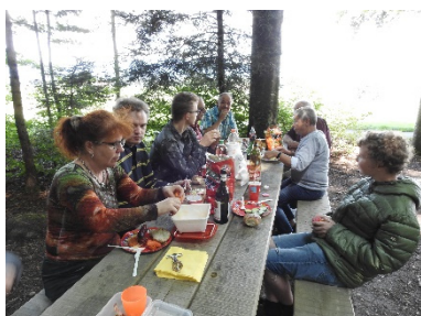
Die gesellige Runde

Es war ein angenehmer und gemütlicher Sonntag. Die von der Zivilschutzorganisation Vorbildlich hergerichtete Feuerstelle bot den angenehmen Rahmen für diesen Anlass. Herzlichen Dank für die gute Arbeit.