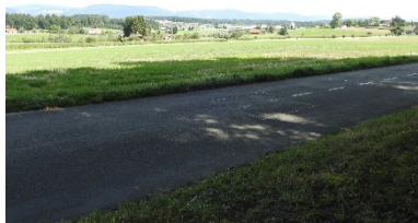
Blick Richtung Bützberg

BS. Das traditionelle Bräteln der SP Sektion Thunstetten-Bützberg fand in diesem Jahr am 20. August 2017 bei der Feuerstelle im „Hölzli-Egge“ in Thunstetten statt.